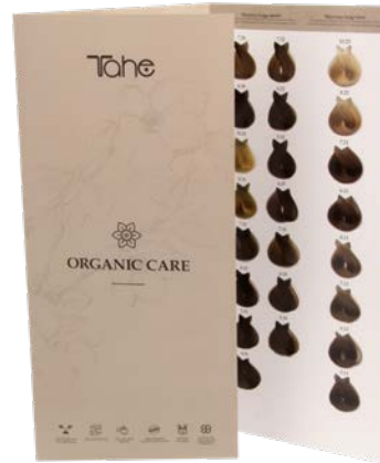
Nuancier Organic Imprimé (12054501)