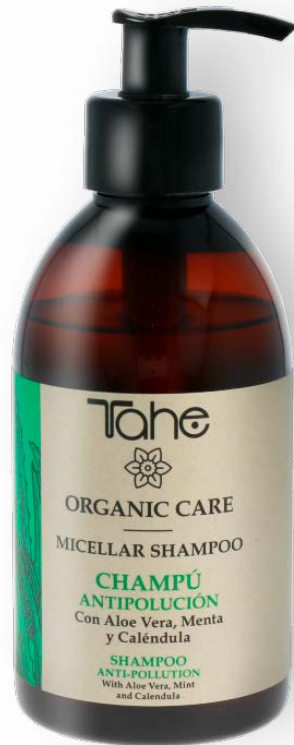
Organic Care Micellar Shampoo