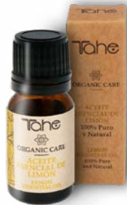
Huile essentielle de Citron 10 ml