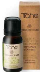
Huile essentielle de Bergamote 10 ml