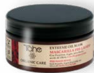
Extreme Oil Mask