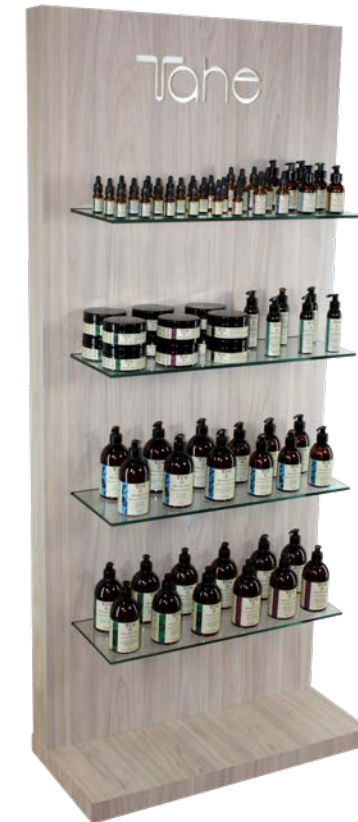
Présentoir Bois avec Éclairage (88880155)