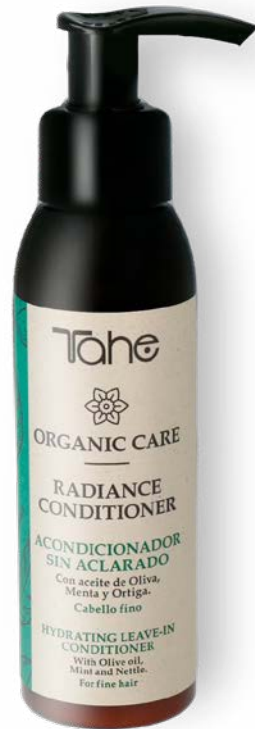
Organic Care Radiance Conditioner 100 ml