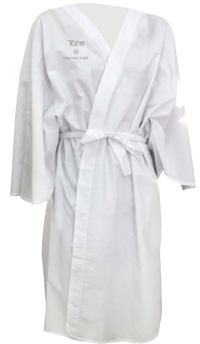
Peignoir client (12049060)