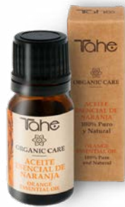
Huile essentielle d'Orange 10 ml