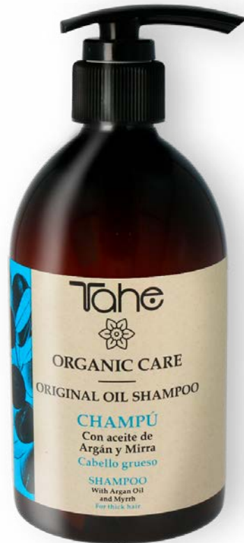
Organic Care Original Oil Shampoo