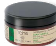
Nutritium Oil Mask