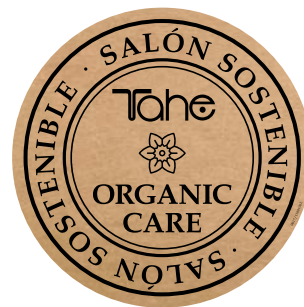
Adhésif Vitrine Vinyle (11001072)