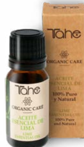
Huile essentielle de Citron Vert 10 ml