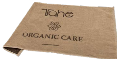
Serviettes Coloration Organic (12049082)