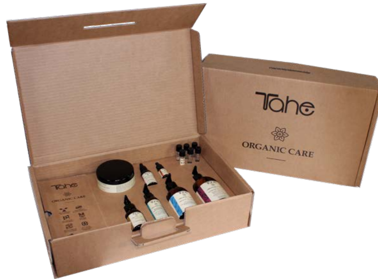
Malette vendeurs (11001044)