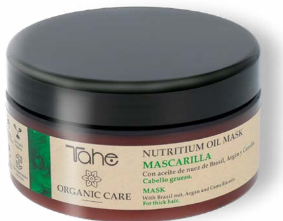
Organic Care Nutritium Oil Mask 300, 500 et 1000 ml