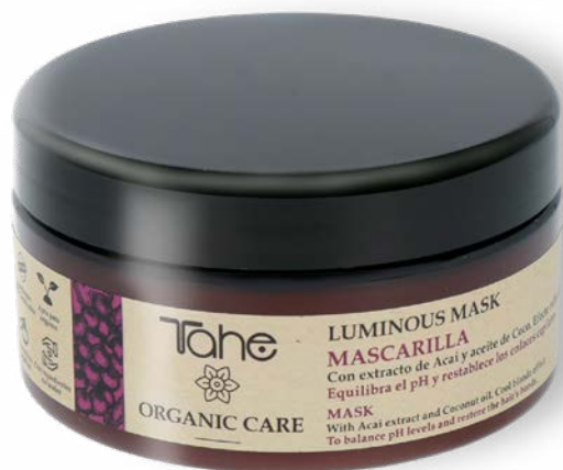
Organic Care Luminous Mask 300 ml