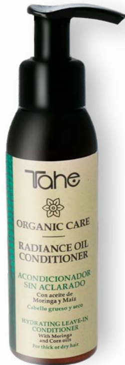
Organic Care Radiance Oil Conditioner 100 ml