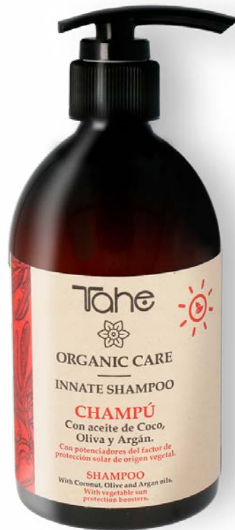
Organic Care Innate Shampoo