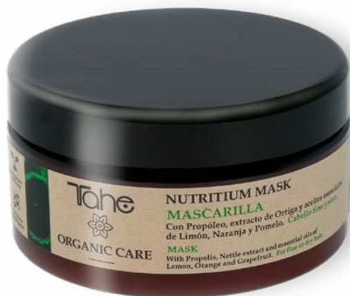
Organic Care Nutritium Mask 300, 500 et 1000 ml