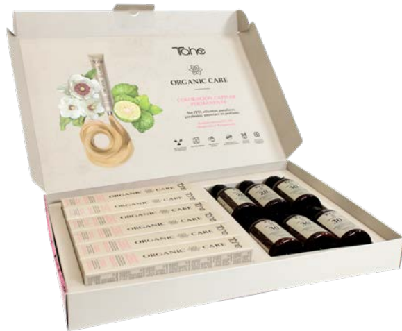
Coffret Bienvenue Coloration (12054503)