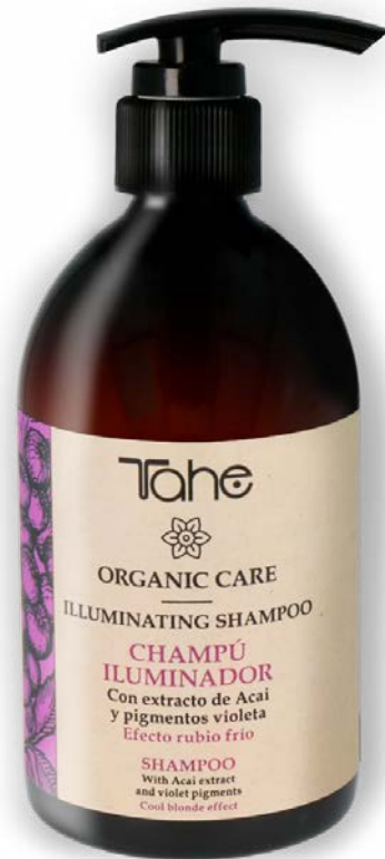
Organic Care Illuminating Shampoo