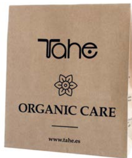
Sac Papier (11027432)