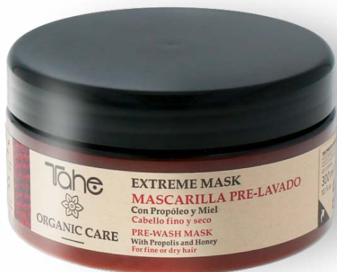
Organic Care Extreme Mask 300 et 500 ml