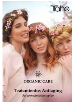
Carte Menu Traitements Anti-âge (11001085)