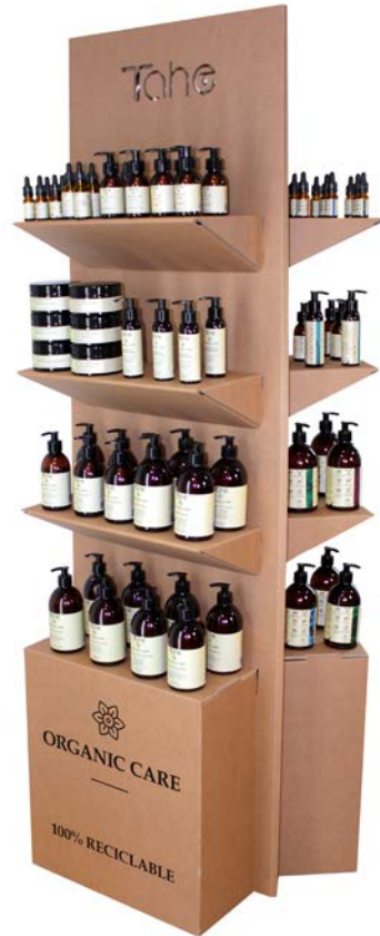
Présentoir Carton (11001043)