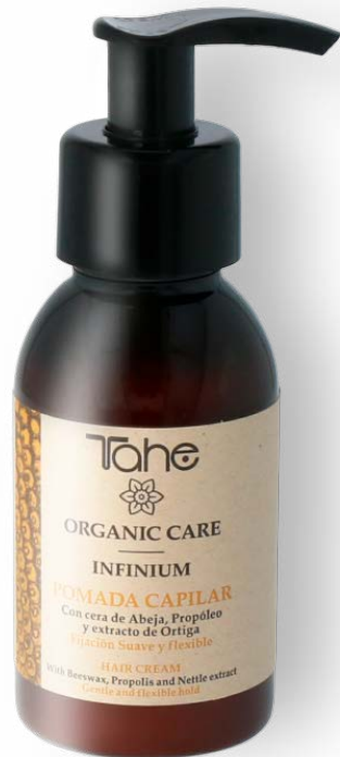
Organic Care Infinium 100 ml