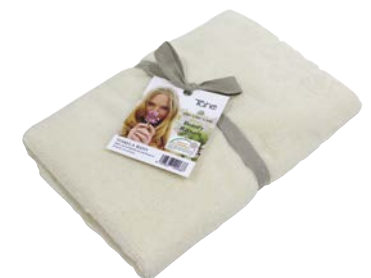
Serviette Coton Bio (12049049)