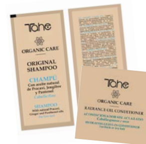
Échantillons (Original Sh/ Original Oil Shampoo/ Nutritium Mask/Nutrium Oil Mask/Radiance Conditioner / Radiance Oil Conditioner)