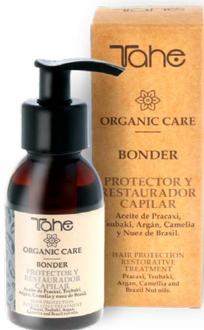
Organic Care Bonder 100 ml