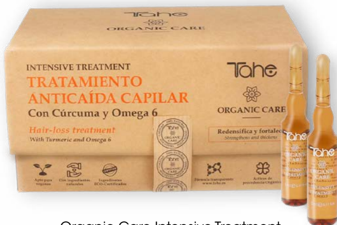
Organic Care Intensive Treatment