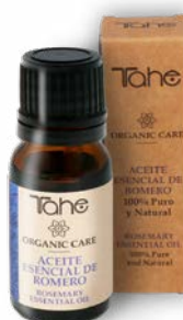
Huile essentielle de Romarin 10 ml