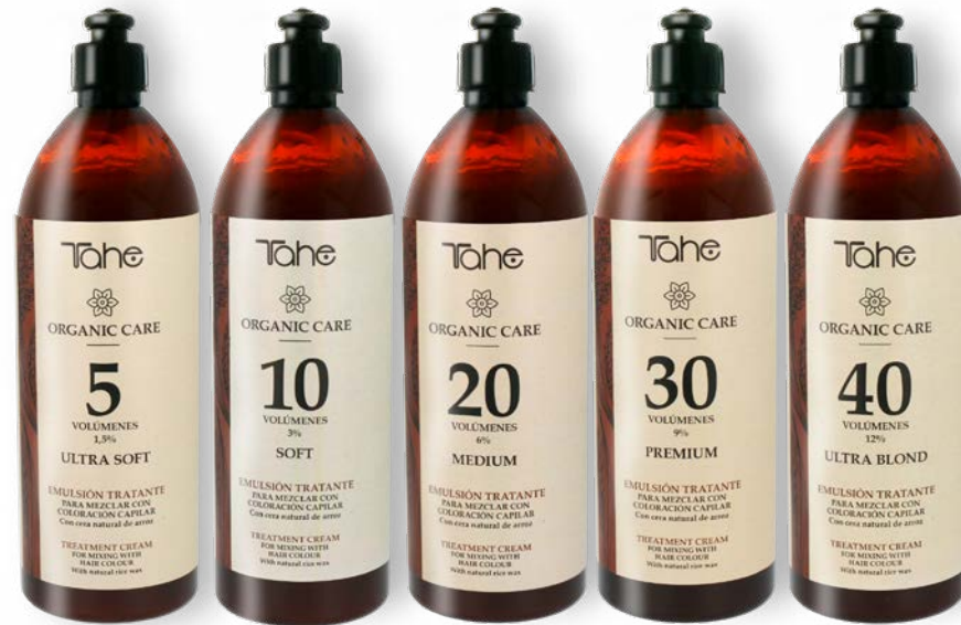
Organic Care Émulsion traitante 100 et 900 ml