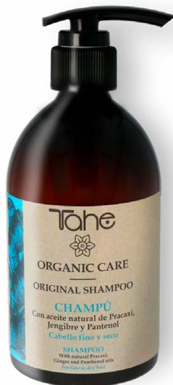
Organic Care Original Shampoo