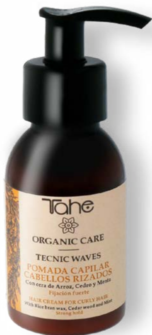
Organic Care Tecnic Waves 100 ml