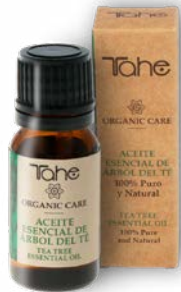
Huile essentielle d'Arbre à Thé 10 ml