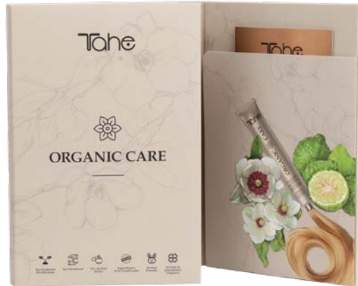
Nuancier Organic (12054500)