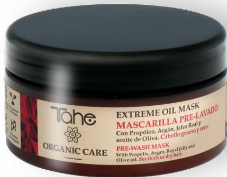
Organic Care Extreme Oil Mask 300 et 500 ml