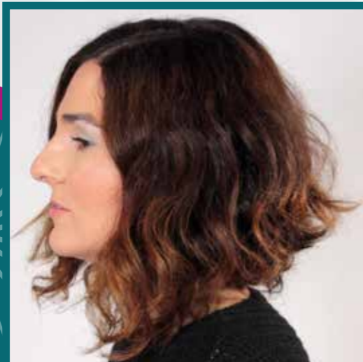
ANTES DE LA APLICACIÓN