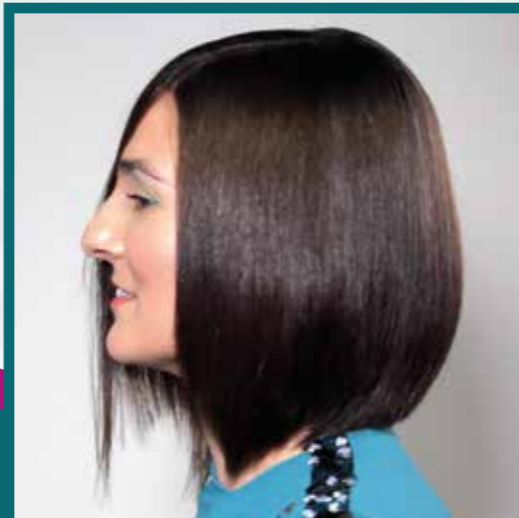
DESPUÉS DE LA APLICACIÓN